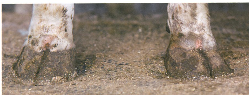
Klovsundhed har gunstig avlsmæssig sammenhæng med holdbarhed.

I de nordiske lande er målet i avlsarbejdet at øge andelen af køer, som overlever op til 4. kælvning. Med dette mål forbedres holdbarheden samtidig med at tyrene får et sikkert indeks, mens de stadig anvendes. Dette skyldes at vi udnytter informationen allerede, når døtrene afslutter 1. eller 2. laktation. Viden